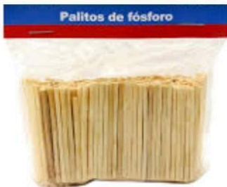
Palitos de fósforo sin cabeza