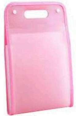
Archivador acordeón vertical