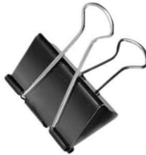
Apretador doble clip