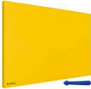
Almohadilla para troquelar tamaño carta