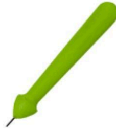
Punzón metálico escolar con punta redonda