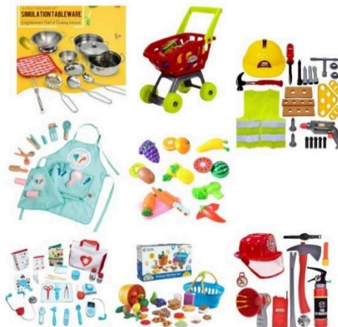
Set juegos de roles